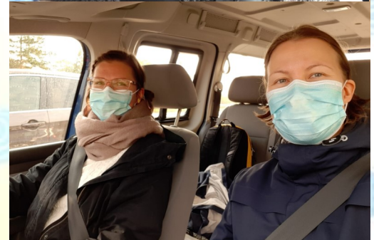
Xamkin tiimi matkustaa 2019 vs. 2020