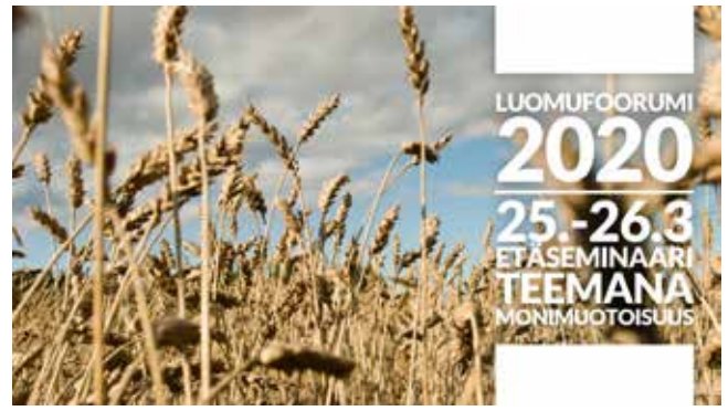
Kuva 9. Luomusiementuotannon fokusryhmän työn tu- lokset esiteltiin Monimuotoinen luomutuotanto -webi- naarissa maaliskuussa 2020.

Julkaisuja tuotettiin kaikkiaan kuusi kappaletta. Hankkeen toiminnasta ja kaakkoissuomalaisista luomuyrittäjistä kirjoitettiin kahdeksan artikke- lia, viisi luomualan ammattilehti Luomulehteen, kaksi Xamkin READ-verkkajulkaisuun ja yksi Elin-