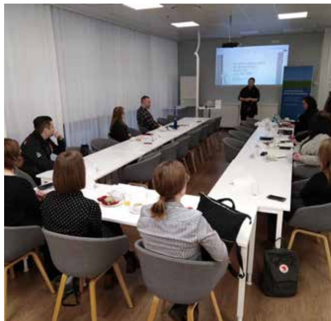
Kuva 7. Paikallisuus ja luomu ovat tärkeässä roolissa matkailuun kehitettävien elämysten suunnittelussa. Asiaa pohdittiin Kouvolassa tammikuuisessa työpajassa.

Suurin osa tilaisuuksista pystyttiin järjestämään suunnitellusti, mutta koronaviruksen aiheuttaman poikkeustilanteen vuoksi keväälle ja kesälle 2020 suunnitellut tapahtumat jouduttiin pääsääntöisesti perumaan. Poikkeustilanne sekä yrittäjien aika- ja resurssipula poikkeustilanne