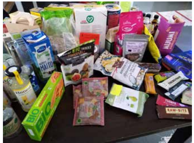
Kuva 8. Kaakkois-Suomen Luomubuumi-työpajassa oli kattava luomutuotenäyttely.

Luomu lentoon Kaakkois-Suomessa -hanke ja valtakunnallinen Ruokasektorin koordinaatiohanke