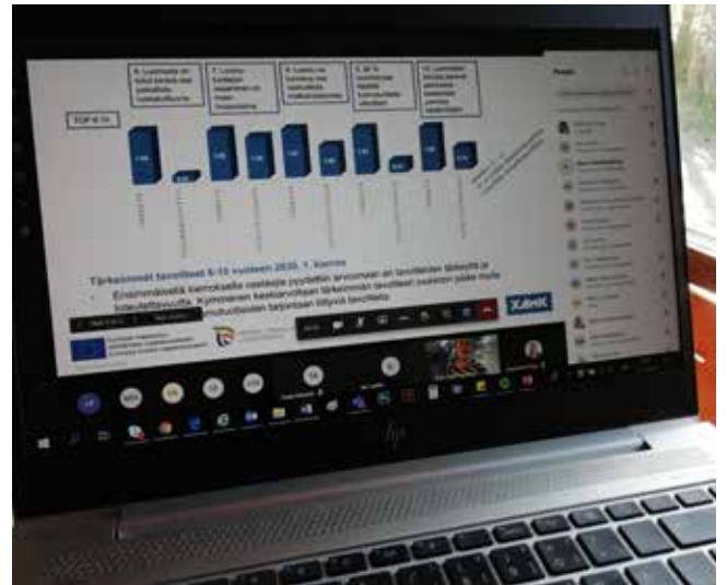
Kuva 3. Kehittäjäryhmien työ siirtyi keväällä 2020 verkkoon.

pyydettiin asettamaan näitä toimenpiteitä tärkeysjärjestykseen sekä arvioimaan niitä ensimmäisen kierroksen teemoja, joihin sisältyi ristiriitoja vastaajien kesken. Lisäksi kysyttiin, mihin toimenpiteisiin vastaajat pystyisivät itse osallistumaan. (eDelphi-kysely 2020.)