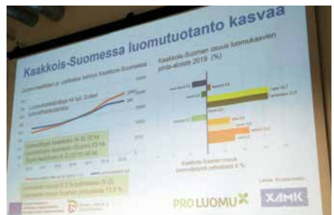
Kuva 1. Alkukartoituksen tuloksia esiteltiin syyskuussa 2019.

Kootun tiedon perusteella hanketiimi työsti nelikenttäanalyysin erikseen kummankin maakunnan tilanteesta ja laati alustavat kehittämissuunnitelmat (Miltä Kaakkois-Suomen luomu näyttää 2019). Nämä julkaistiin edelleen työstettäväksi seminaareissa 18.9.2019 Lappeenrannassa ja 19.9.2019 Kouvolassa, ja ne on esitelty tarkemmin seuraavissa alaluvuissa.