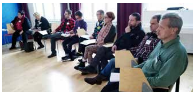
Kuvat 5 ja 6. Miniseminaarien yleisöä Kouvolassa ja Lappeenrannassa syyskuussa 2019.