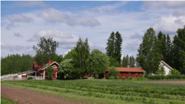
Vertin tila, www.vertti.fi , facebook.com/vertintila