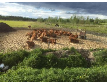
Harjun Maatalous Oy, facebook.com/HarjunLuomuOy