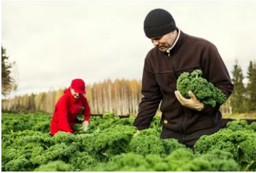
Kalliolan luomu, www.kalliolanluomu.fi , facebook.com/kalliolanluomu