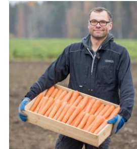
Lietlahden tila, www.lietlahti.fi