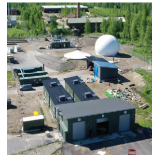
BioHauki Oy, www.biohauki.fi , facebook.com/BioHauki