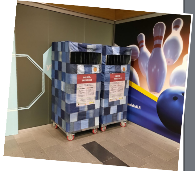
Poistotekstiilin keräysrullakot Kauppakeskus Akselissa