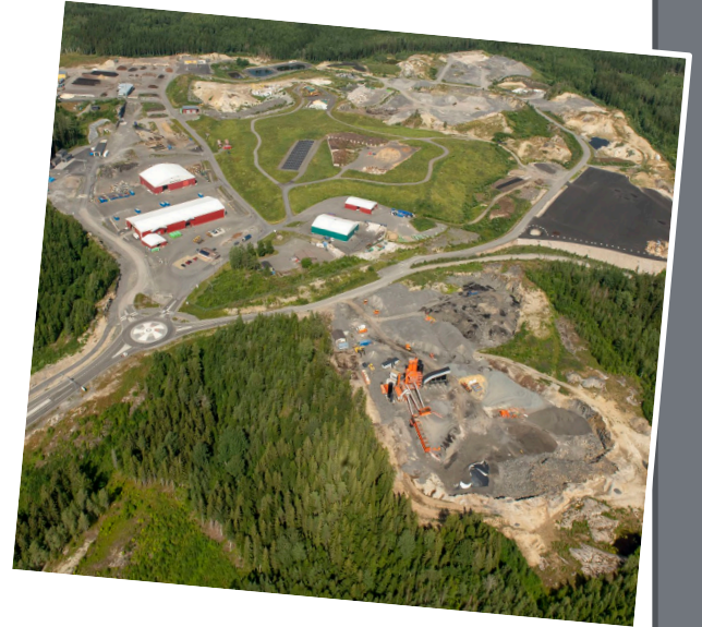
Metsäsairilan lajittelu- ja kierrätyskeskus