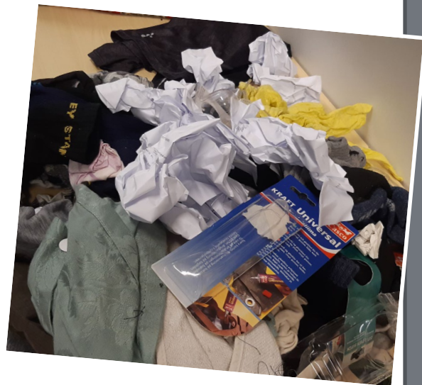
Muuta jätettä poistotekstiilien seassa