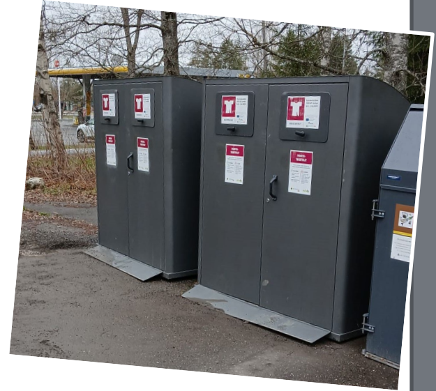
Rantakylän ekopisteen keräyskokeilu