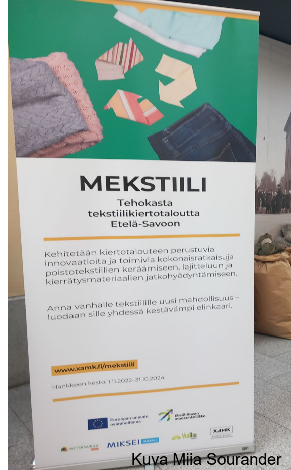
Kuva Miia Sourander