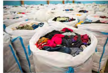
Tekstiilien kierrätettyyn vaikuttavat useat asiat, kuten materiaalin laatu

Lounais-Suomen jätehuolto jalostaa suomalaisten kotitalouksien poistotekstiiliä kierrätysraaka-aineeksi uusien tuotteiden valmistukseen.