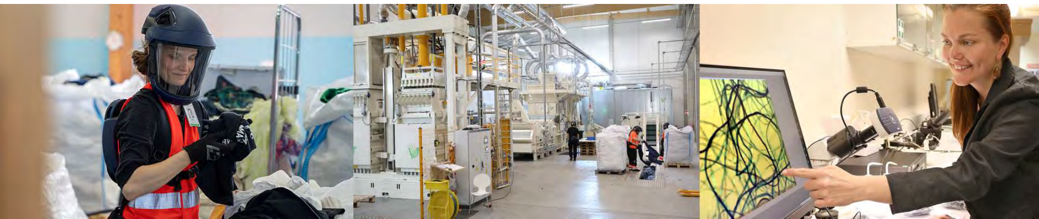
Valtakunnallinen keräys & lajittelu