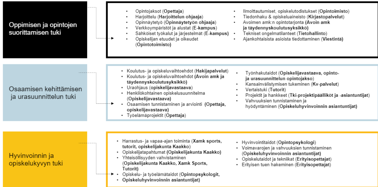
Kuvio 5. Opiskelijan ohjaustarpeet eri ohjauksen tavoitteissa sekä niissä tukeva ohjaushenkilöstö (Karvo 2021)

Koulutusalat. Opiskelijavastaavat ohjaavat opiskelijoita opintojen ja uran suunnittelussa sekä henkilökohtaisen opiskelusuunnitelman laatimisessa ja osaamisen tunnistamisessa ja arvioinnissa. Opettajat ohjaavat opiskelijoita opintojaksoilla ja työelämäprojekteissa sekä osaamisen tunnistamisessa ja arvioinnissa. Opinnäytetyöohjaajat ohjaavat opiskelijaa opinnäytetöissä ja harjoittelun ohjaajat työelämäharjoitteluissa.